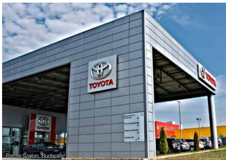
Toyota Szalon, Budapest

különböző szélességi és magassági méretekben, többféle bevonat és szín közül választható ki az épülethez és a vevői igényekhez legjobban illeszkedő kazettás burkolat. A kazettákkal együtt az egyedi sarokmegoldások és illesztések adják meg a termék tökéletes homlokzati összhangját.