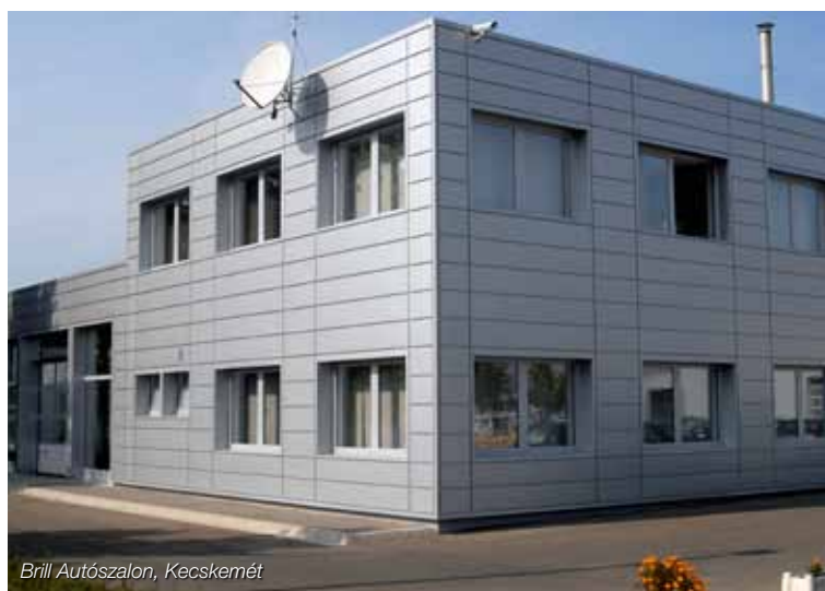
Brill Autószalon, Kecskemét

A kazettákkal azonos színű rögzítő csavarokból és különböző takaró szegélylemezekből álló teljes tartozékrendszer könnyedén és hatékonyan biztosítja az elegáns és tartós felületképzést. A nyílászárók vonalvezetése és a sarkok kiképzése is az elegáns homlokzati megjelenését biztosítják.