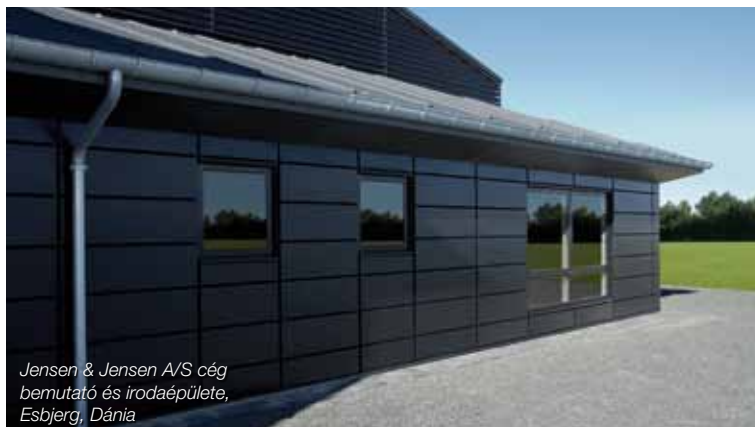
Jensen & Jensen A/S cég bemutató és irodaépülete, Esbjerg, Dánia

Az acél falkazetták külső felületére különböző fajtájú és színű bevonatok kerülnek. Az ECO falkazetták a standard 25µm vastag poliészter bevonattal 5 féle kedvelt színben (fehér, ezüst, sötétkék, sötétszürke, bézs) állnak rendelkezésre. Az új fejlesztésű PREMIUM falkazetták kétféle bevonattal készülnek: a 20µm PVDF bevonatot 4 alapszínben (fehér, fekete, ezüst, antracit metál); míg a speciális porszórásos technológiával felvitt fedőfestéket bármilyen RAL/NCS színkóddal megadva biztosítani tudjuk.