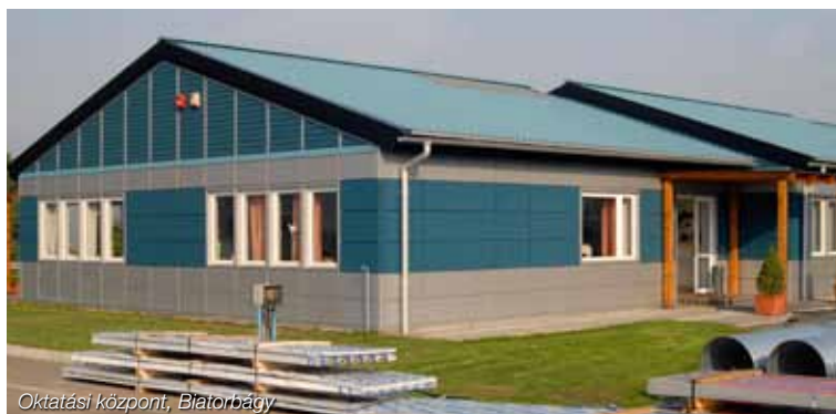
Oktatási központ, Blătorbágy

A cég teljes működése az ISO 14001-es környezetvédelmi tanúsítási rendszer alapján működik. Az alkalmazott alapanyagok újrahasznosíthatók, a termékek előállításához szükséges tevékenységek nem szennyezik a környezetet.