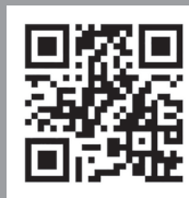
AquaBead Flex Pro